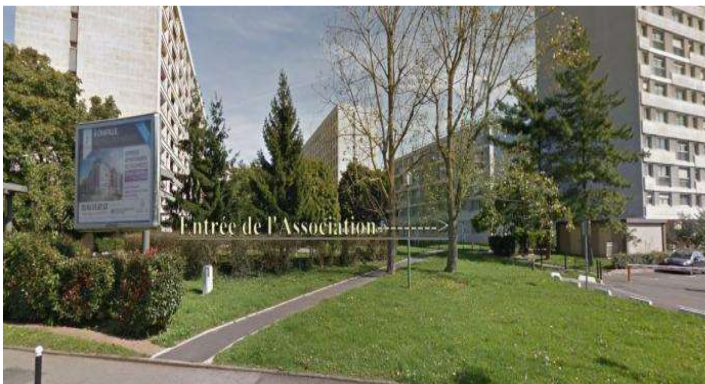
ENTREE DE L'ASSOCIATION SUIVRE LA FLECHE

Je note les activités que j'ai souhaité réaliser avec l'Association Familiale MLF